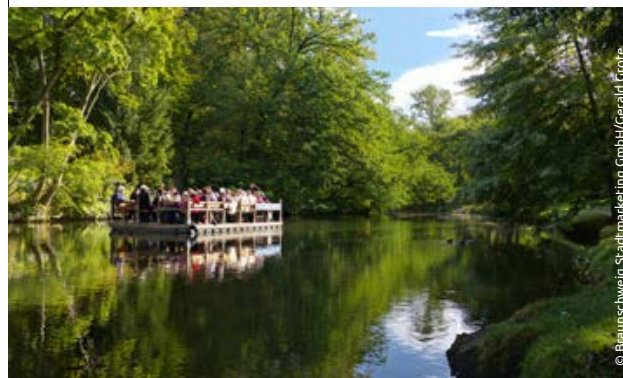
Lebensqualität | Quality of life