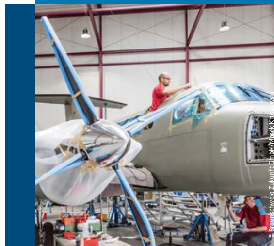
Innovation | Innovation

Wir drucken klimaneutral. | We use climate-neutral printing.